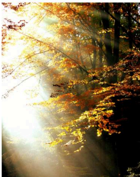
- ds. Elise Wijnands

In de veertigdagentijd kalender 2024 staat een gebed dat ik graag deze veertigdagentijd mee wil geven.